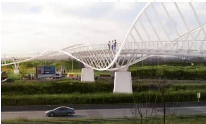
La passerelle reliant l'île de loisirs de Créteil à la Tégéval (lancement du chantier en octobre 2014)