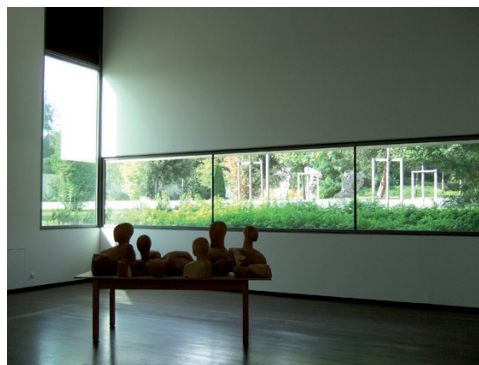
Jardin du MacVal, vue depuis l'intérieur

Départ : accueil du musée (place de la Libération, 94400 Vitry-sur-Seine)