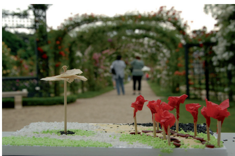
Maquette un jardin dans ma main © CAUE94