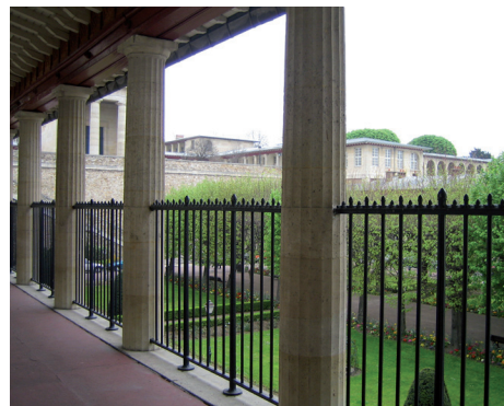
Jardin de l'hôpital Esquirol

Départ : entrée du parc (rue de Rome, 94700 Maisons-Alfort)