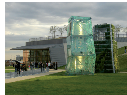
Centre commercial de la Vache Noire

Départ : devant l'entrée du centre commercial (carrefour de la Vache noire, 94110 Arcueil)