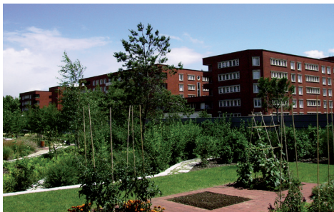
Parc Vert-de-Maisons © CAUE94