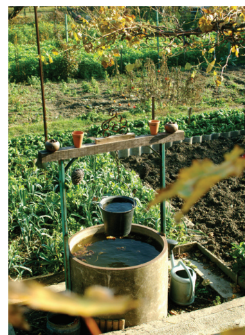
Jardins familiaux de Créteil