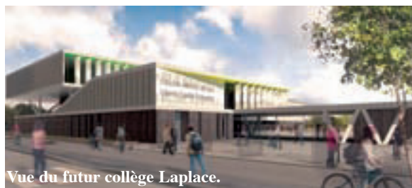
Vue du futur collège Laplace.

Objectif : un collège à la hauteur de ses ambitions