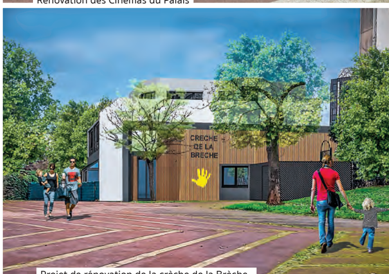
Projet de rénovation de la crèche de la Brèche