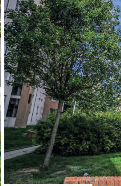
7 – Front de Lac, Ormetteau, Port