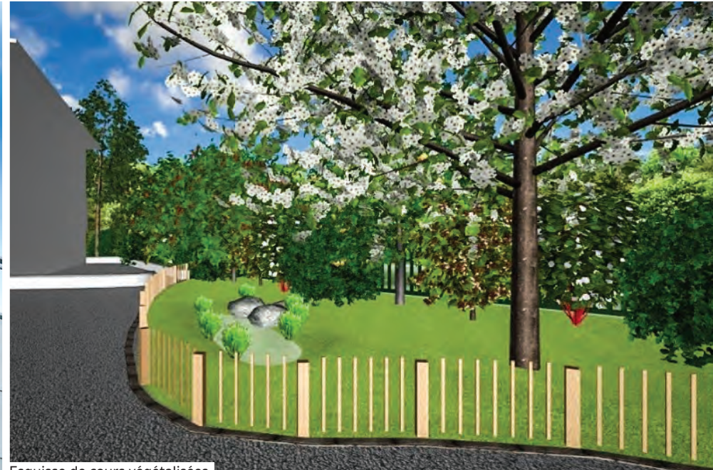
Esquisse de cours végétalisées