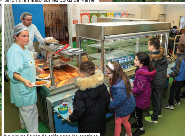
Nouvelles lignes de selfs dans les cantines