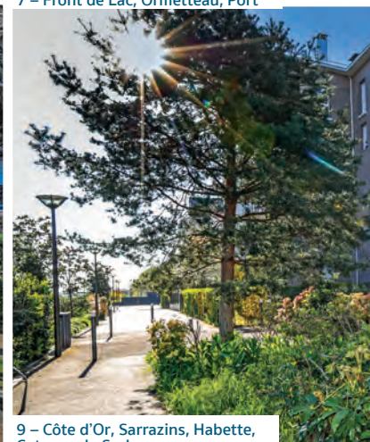
9 – Côte d'Or, Sarrazins, Habette, Coteaux du Sud