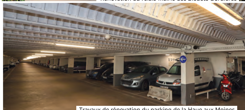
Travaux de rénovation du parking de la Haye aux Moines