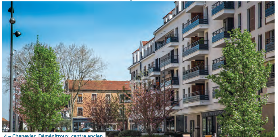
4 – Chenevier, Déménitroux, centre ancien