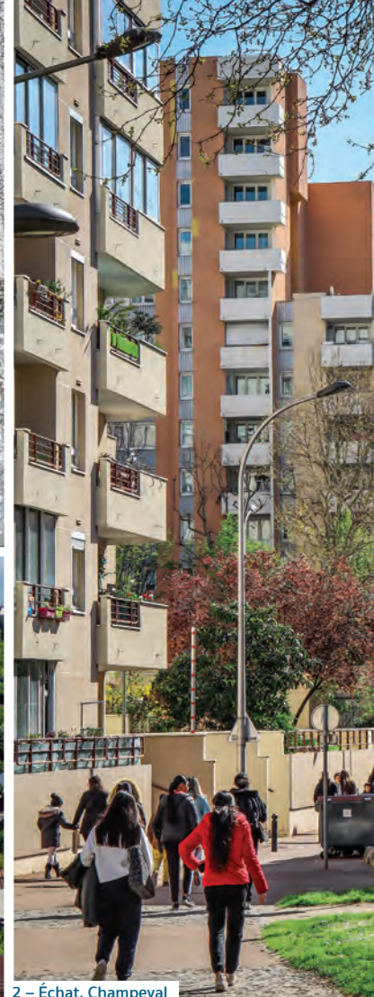
2 – Échat, Champeval