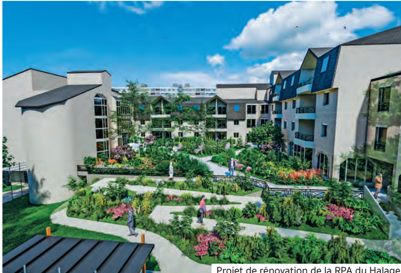
Projet de rénovation de la RPA du Halage

L'année 2023 marque la suppression totale de la taxe d'habitation sur les résidences principales. En revanche, dans son projet de loi de finances, le gouvernement a refusé de plafonner la révision des bases locatives, qui servent de base de calcul à la taxe foncière. Afin de limiter la pression fiscale sur les propriétaires cristoliens, la municipalité s'est engagée à geler les taux d'impôts locaux qui lui incombent. Malgré ce geste fort en faveur du pouvoir d'achat des habitants, leur facture subira une augmentation de 7,1%.