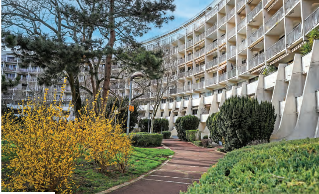
6 – Montaigt, Palais