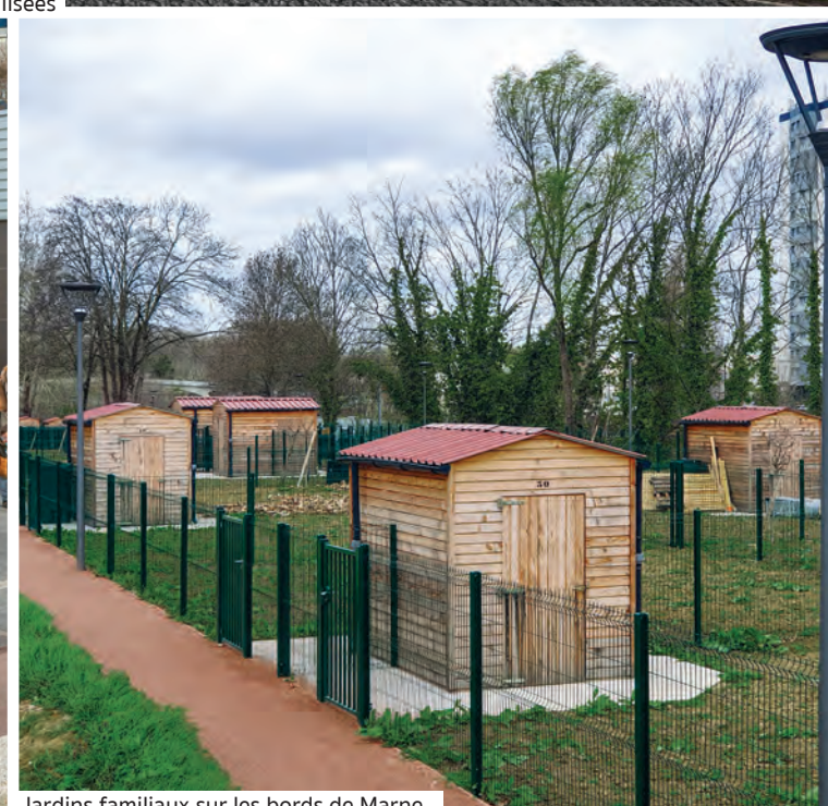
Jardins familiaux sur les bords de Marne