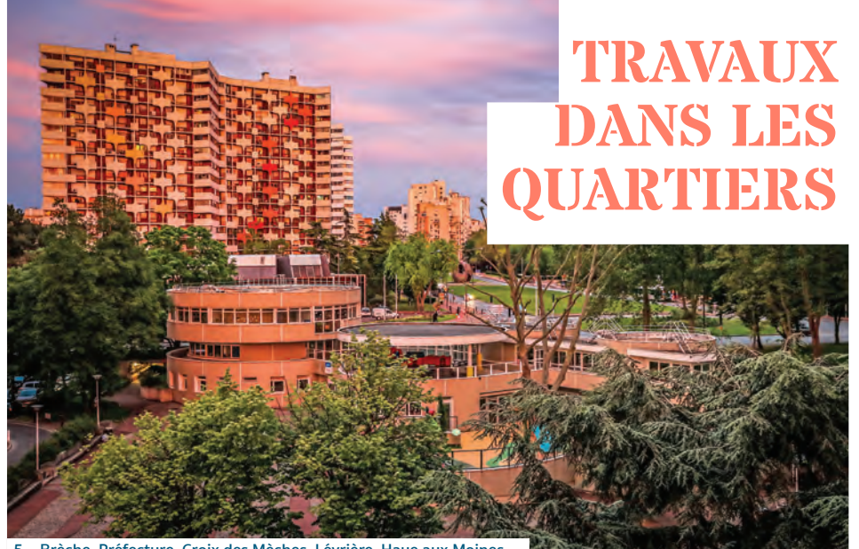
5 – Brèche, Préfecture, Croix des Mèches, Lévrierie, Haye aux Moines