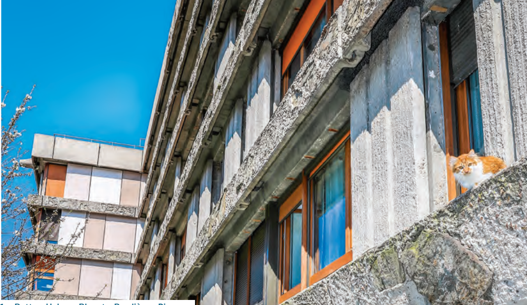
1 – Buttes, Halage, Bleuets, Bordières, Pinsons