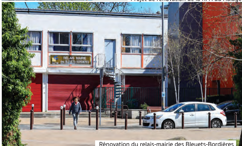
Rénovation du relais-mairie des Bleuets-Bordières