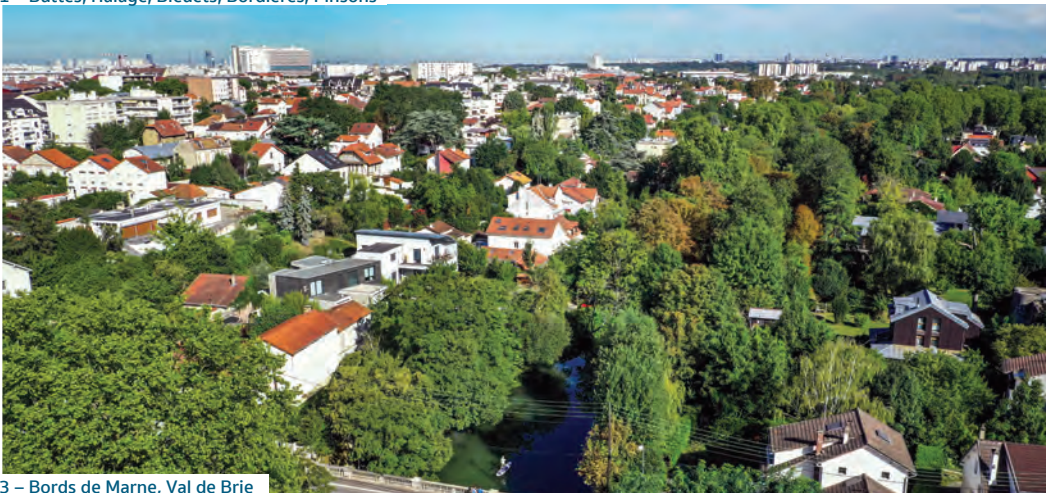
3 – Bords de Marne, Val de Brie