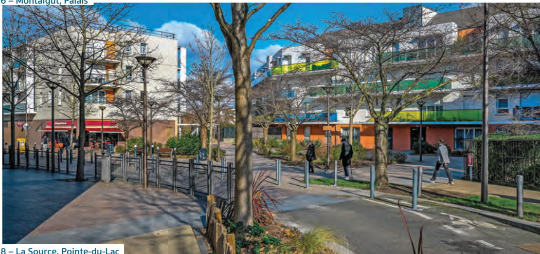
8 – La Source, Pointe-du-Lac