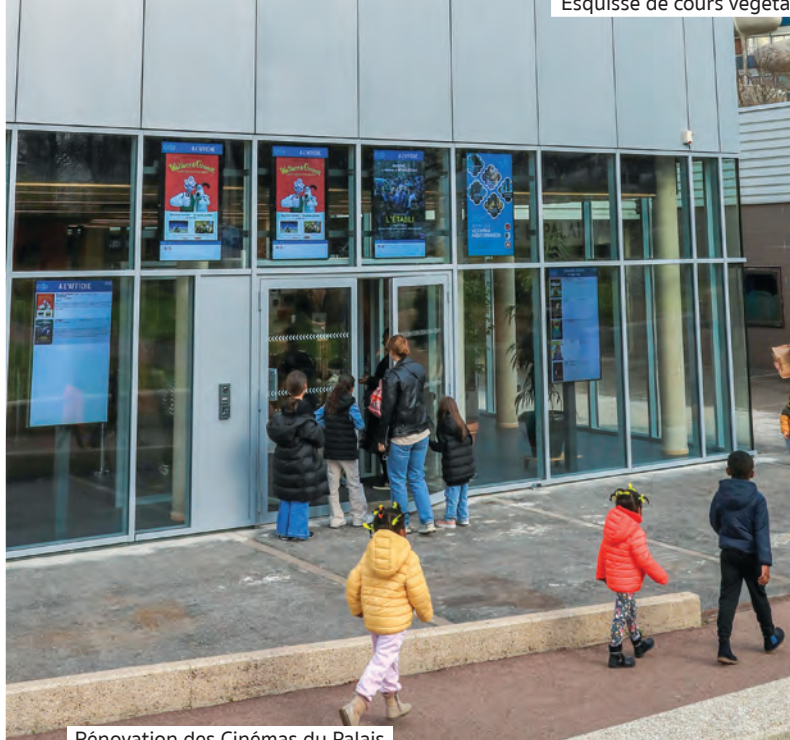
Rénovation des Cinémas du Palais